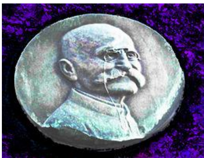
Bronze représentant Paul de Vivie, dit Velocio, à Pernes-les-Fontaines