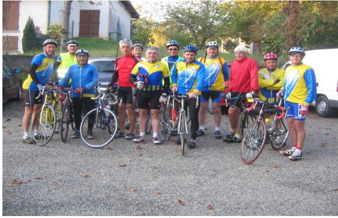
Le groupe de la journée club 2008 (Absent sur la photo Joseph LARROQUANT)